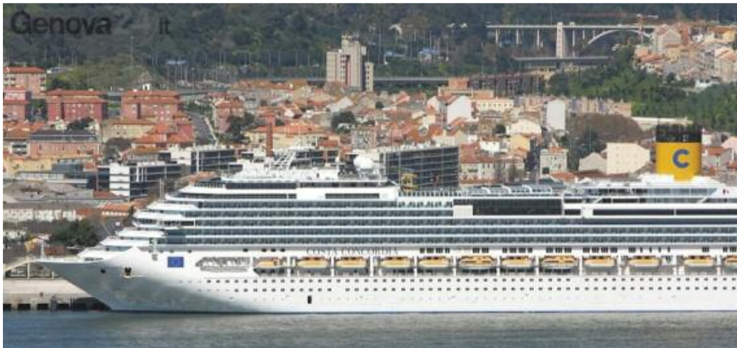
La nave della Costa Crociere, nel porto genovese, ha accolto il vivace e rumoroso XXX Congresso dell'Avvocatura italiana. Il prossimo Congresso si terrà a Bari dove torna dopo cinquant'anni.

Crede che anche negli anni passati coloro che hanno avuto l'onore e l'onere di occuparsi delle nostre cose, non abbiano lesinato il loro impegno in favore della categoria. Vi è che i tempi sono cambiati e la risposta alle emergenze (continue) richiede tempi strettissimi e, quindi, sforzi maggiori. Vedo una partecipazione più attiva da parte di molti: se un merito possiamo riconoscerlo a questo Consiglio è certamente quello di una notevole capacità di coinvolgimento anche di quanti mostravano un certo scetticismo. Co-